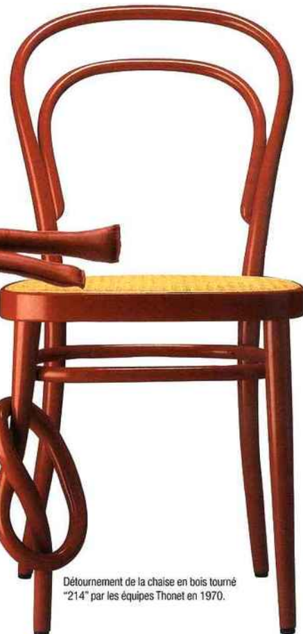
Détournement de la chaise en bois tourné "214" par les équipes Thonet en 1970.

La chaise en bois tourné "214" de Thonet fête ses 150 ans. Présentée à Vienne en 1859 par Michaël Thonet, elle est la chaise la plus produite, avec 50 millions de chaises authentiques vendues et certainement autant de copies. Sa production se perpétue à Frankenberg dans le nord de la Hesse suivant la méthode révolutionnaire du bois courbé. Première chaise industrielle, elle se décomposait à plat en cinq éléments et une caisse d'un mètre cube permettait de transporter 36 chaises démontées d'où un programme d'expédition sans limites en Europe, en Amérique du Nord, en Amérique du Sud, en Asie et en Afrique. Cohérence, économie de matériaux ont fait de cette chaise le modèle préféré des designers qui ont cherché plus d'une fois à la redessiner, à la détourner sans réussir à la surpasser.