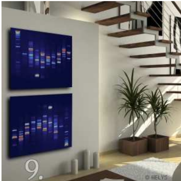
/9. Tableau ADN, notre empreinte biologique révélée et fixée par Helys, à partir de 249 €.

Beaucoup d'enseignes de décoration proposent des sélections de posters et de cadres, mais rapidement nos comportements moutonniers se révèlent et les posters se jettent à nos murs comme des coussins sur un canapé. La crainte de l'erreur de jugement, la honte d'un développement culturel proche de l'amibe ou simplement l'envie d'apporter une pointe de couleur sans pour autant vouloir parler d'art... nous conduit à nous différencier dans la répétition du déjà-vu.