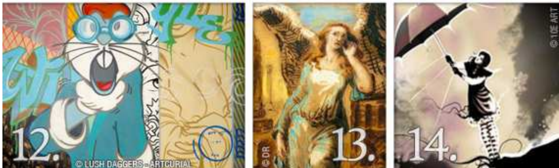
[10. Triptyque Week-end à Venise de Tony Duarte , tirage numérique, trois toiles de 120 x 40 cm, 252 € sur Imagine Design. [11. Bilalhommage de Driian , poster sur bâche 200 x 60 cm, 175 € sur Amkashop. [12. Crash , peinture aérosol et laque sur toile de Lush Daggers, estimée entre 30 000 et 40 000 € par la maison Artcurial. [13. Allégorie de l'histoire d'Achille Augustin Calon , signée et datée 1851, plume lavis et pastel (23,2 x 30,7 cm), estimée en 2007 par la maison Artcurial entre 300 et 400 €. [14. Alice , toile numérique de Driian, tirage sur bâche agrafée sur châssis 30 x 40 cm, 85 €, sur 10eArt.

Lassé de reproduire, l'espace numérique se met au service des artistes. Identité particulière, les arts graphiques revitalisent l'expression artistique de leur langage. L'imaginaire et l'imagination sont sans limite, la création est là. Le dessin déborde pour s'exalter en grand format ou pour gagner des supports atypiques comme des Toys, des jerricanes, des planches de skateboard ou encore des guitares avec des allures de custom. Les créations d'artistes s'éditent et se vendent, sélectionnées par le plus impitoyable des juges : le grand public via une galerie création. « Dessin vectoriel, peinture numérique, collage, 3D, photo ou technique mixte, chaque œuvre est numérotée et tirée à deux cents exemplaires maximum quel que soit le support » souligne Thomas Gayet, fondateur de Amkashop. Élégance, raffinement, qualité, univers affirmés, série limitée, émotion à chaque toile et prix abordables... Les raisons sont nombreuses de s'attarder sur le site. Dans le même ordre d'expression graphique, le site 10e Art propose une très belle sélection de tableaux numériques, édités en série limitée, avec l'occasion pour chacun de se laisser séduire par une œuvre originale. L'art numérique se donne également à voir sur la galerie Imagine Design qui vaut le détour ne serait-ce que pour découvrir les séries Expo Venise et I Love Paris de Tony Duarte.