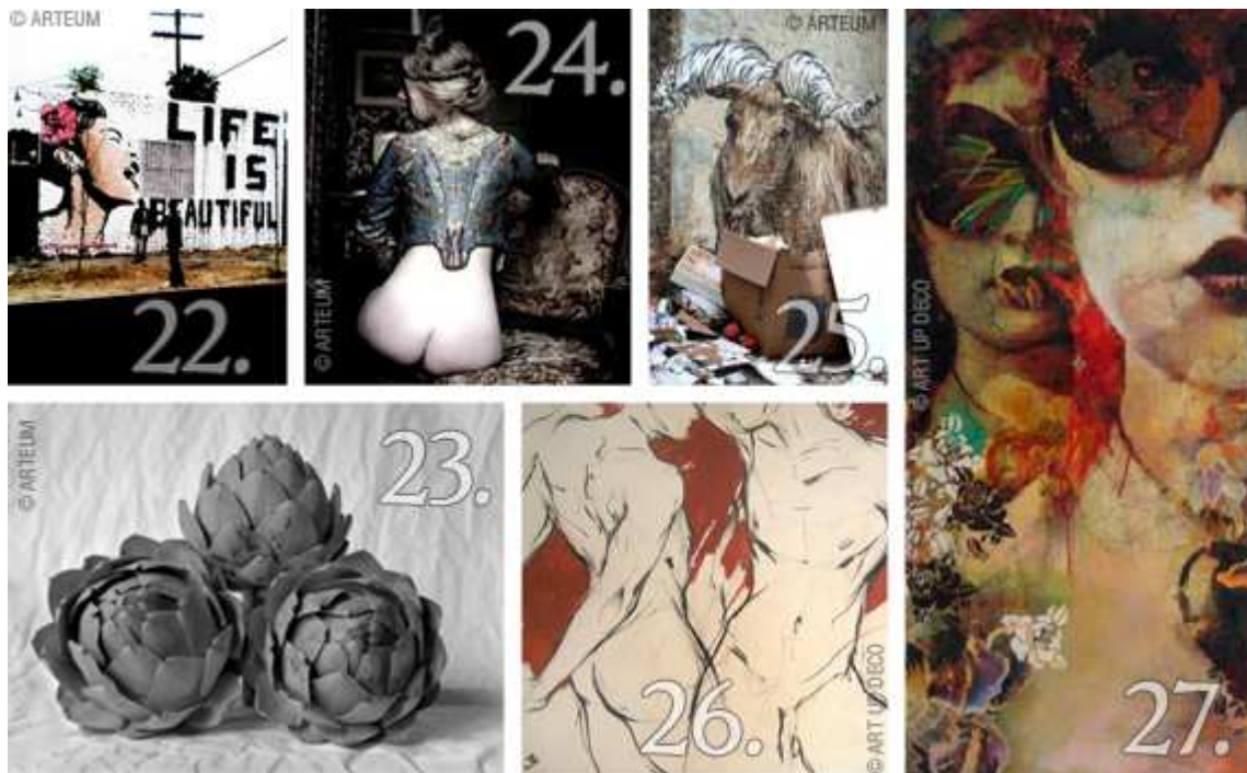
[22. Life is beautiful de Vanessa Atlan , tirage numérique contrecollé sur aluminium, 40 x 50 cm, série numérotée et limitée à cent exemplaires, 100 €, chez Arteum. [23. Artichauts de Christopher Deedes , tirage "Fine art" avec encres pigmentaires, 20 x 30 cm, édition numérotée et limitée à 100 exemplaires, 100 €, chez Arteum. [24. Petit Soldat de Lou Keogh , tirage photographique encadré, 20 x 20 cm, 120 €, chez Arteum. [25. George W. de Sophie Perinet-Lefevre , tirage argentique encadré, 110 €, chez Arteum. [26. One foot on top de Jerry Lemon , acrylique sur toile de lin 80 x 80 cm, 550 €, chez Art Up Déco. [27. Le sortilège des filles Higrd d'Argante , technique mixte sur toile 65 x 100 cm, 650 €, chez Art Up Déco.