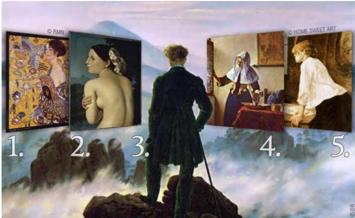
1. Ritratto di Signora de Gustav Klimt , affiche contemporaine 69 x 69 cm, 58 €, sur Muzéo Collection. 2. La baigneuse de Jean-Auguste-Dominique Ingres , reproduction sur toile tendue sur châssis 41 x 33 cm, 118 €, sur Muzéo Collection. 3. Voyage au dessus des nuages de Caspar David Friedrich . 4. La jeune femme à l'aiguière de Johannes Vermeer , reproduction exécutée par un copiste professionnel, 40 x 45 cm, 225 € sur Home Sweet Art. 5. La blanchisseuse d'Henri de Toulouse Lautrec , reproduction exécutée par un copiste professionnel, 50 x 60 cm, 170 € sur Home Sweet Art.

préférence, mais le choix est vaste et la tentation est grande de mettre nos goûts dans le goût du moment et selon les expositions, d'y rechercher L'Estaque de Paul Cézanne, les Demoiselles d'Avignon de Pablo Picasso ou ses encres taurines, les Tournesols de Vincent van Gogh, les baigneuses ou le bain Turc de Ingres ou plus récemment l'univers féminin de Klimt.